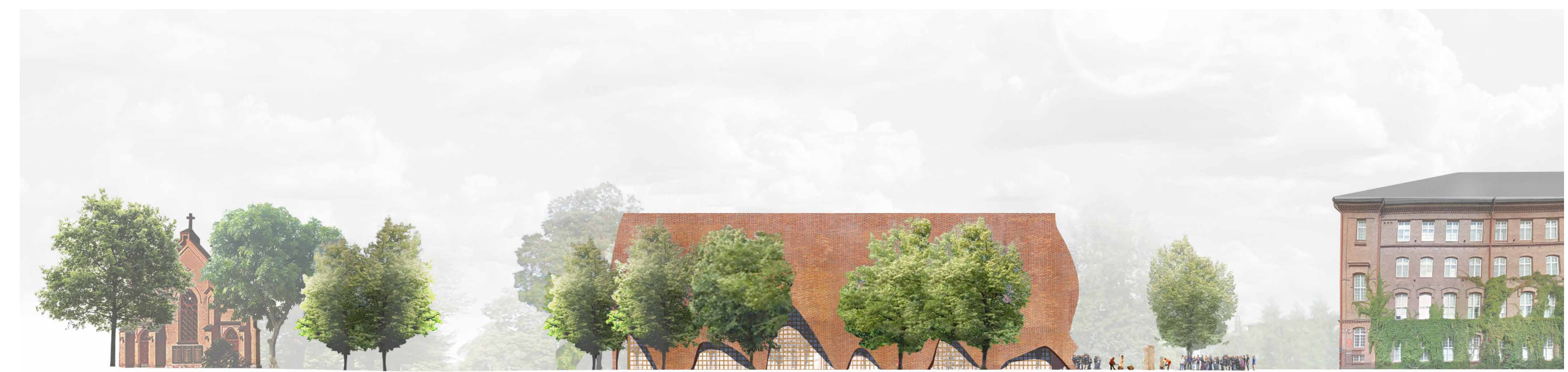
ALUEJULKISIVU FINLAYSONINKADULTA 1:500