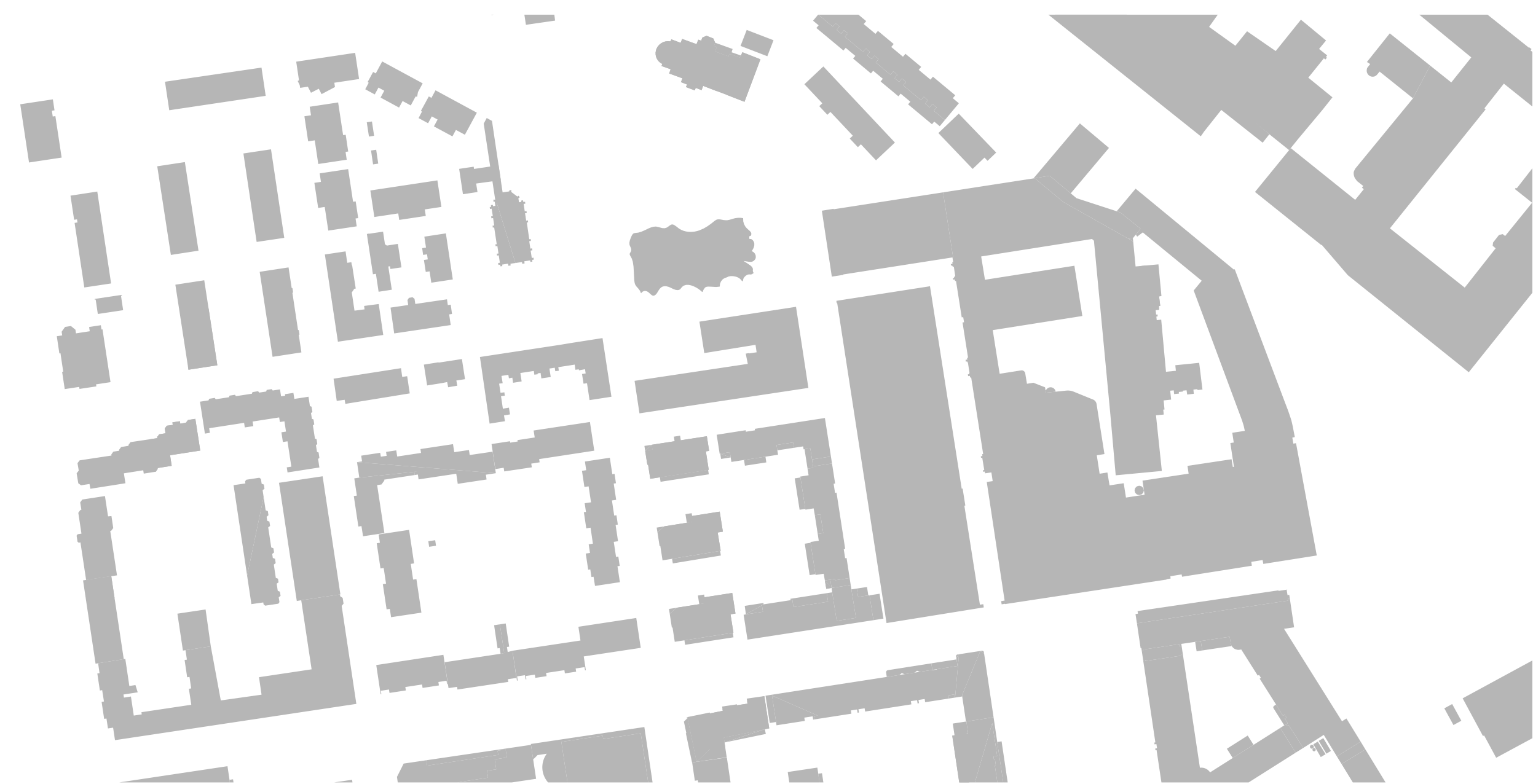
RAKEISUUS 1:2 000