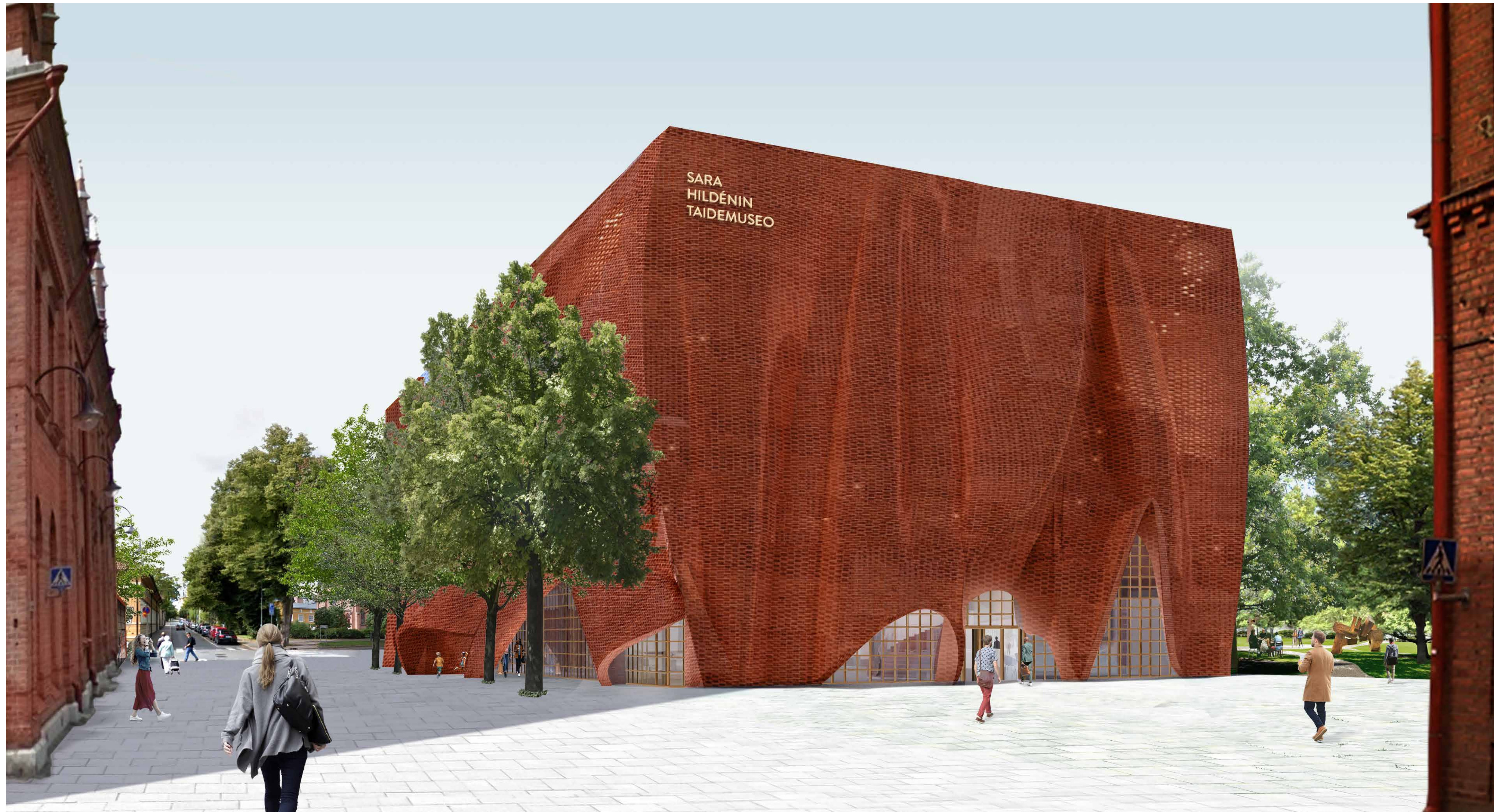
NÄKYMÄ SAAVUTTAESSA TEHDASALUELTA